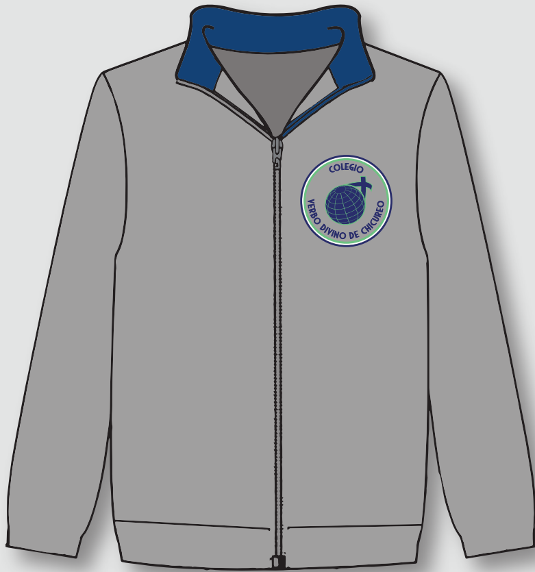
○ Polerón de algodón gris

UNIFORME DEPORTIVO | De 5° básico a IV medio