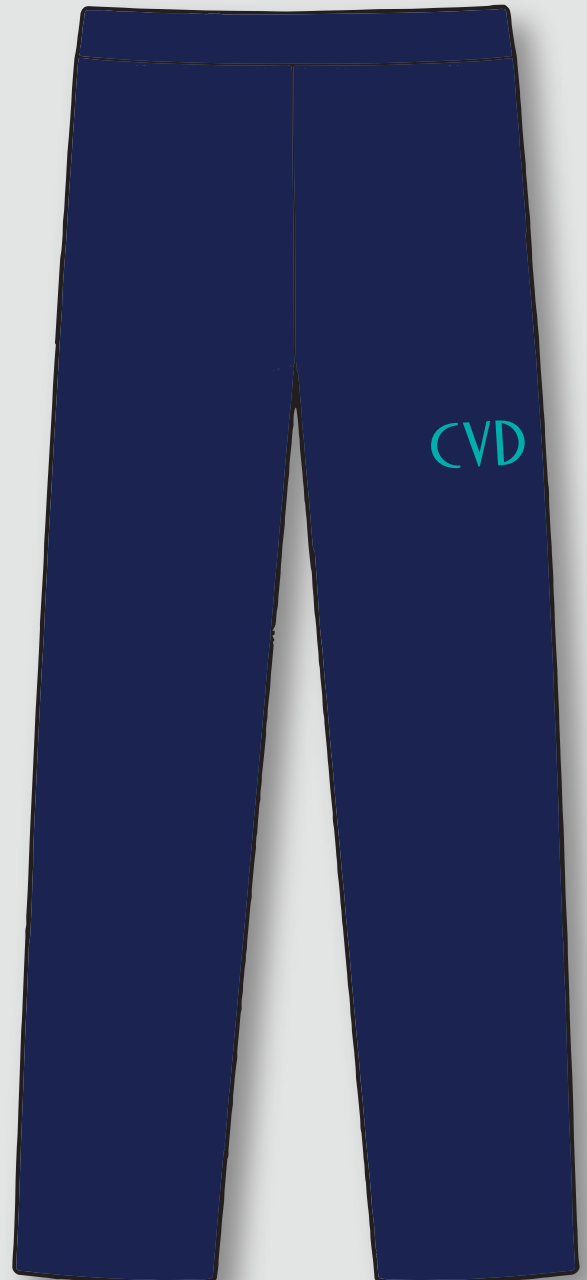
Pantalón buzo azul marino ○