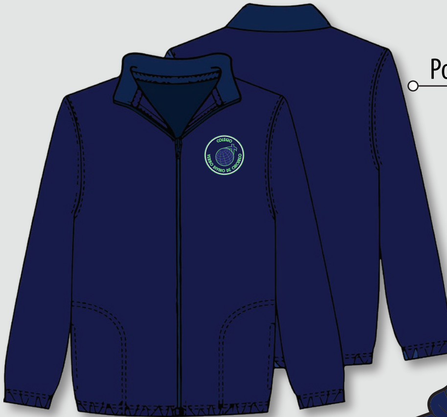
Polar azul marino

COMPLEMENTO PARA INVIERNO | De 5° básico a IV medio.